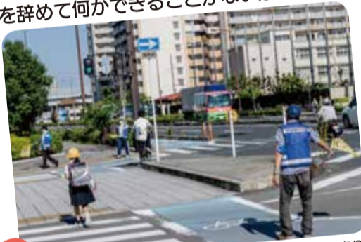
黄色い旗を持って子どもの登校を見守り

朝の7時30分、すでに30度を超える暑さの中、子どもの登下校の見守りのため、ボランティアの皆さんは道路に立ちます。「警備員の仕事をしていたので役に立てると思って活動を始めました」「タクシーの運転手をしていました。仕事を辞めて何かできないかと思って、あとは妻に誘われたので..(笑)」と取材を通して活動のきっかけをお聞きすることができました。子どもたちが元気よくあいさつしてくれることがうれしいと活動されています。