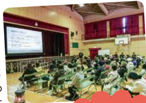
地域の防災訓練でも活躍

「最初に防災への関心をいただいたのは、阪神淡路大震災でした」「何か自分にできることはないのかと考え、さまざまな災害ボランティア活動へ参加しました」とお話しくださったAさん。災害ボランティア活動では、泥出しや家財道具の搬出などの力仕事や傾聴活動、仮設住宅の訪問など多種多様な活動をおこなったそうです。現地では、コミュニティ形成・日々の人間関係(コミュニケーション)の大切さを痛感したそうです。この経験を自分の地域で活かしたいと考え、Aさんは地域の防災リーダーへ登録。現在は、日々地域の方々とコミュニケーションを大切に、地域の輪を広げながら、活動されています。