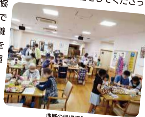
地域の居場所「こうのとりタマゴ」

「どこの地域も同じだと思うけれど、担い手の世代交代を考えていけないといけない。時間がかかっても、知らず知らずのうちに、自然と仲間になっていく、そんな取組みが大切」そう話をしてくださった皆さんは、「長原東地域活動協議会」の構成団体の1つである社会福祉施設「特別養護老人ホームこうのとり」を活用しながら、世代を超えた居場所づくりに取り組んでいます。ここには子どもから大人まで、さまざまな方が集まります。