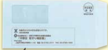
この封筒で郵送しています

平野区見守り相談室では、「要援護者名簿」を作成しています。 大阪府が管理している行政情報をもとに、対象者の方へ見守り相談室から要援護者名簿登録の案内を郵送しています。案内が届いた方は、登録希望の有無を必ずご返送いただきますようお願いいたします。