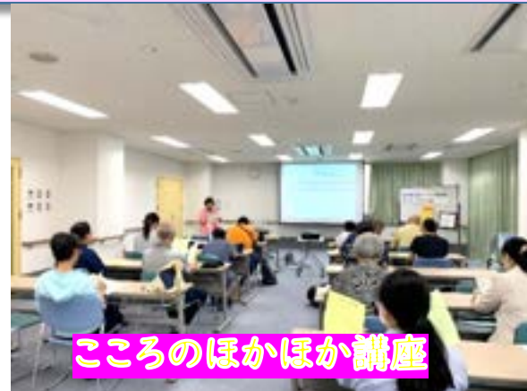
こころのほかほか講座

大阪市より新型コロナウイルス感染症の影響により、緊急事態宣言等の発令があった場合、または、大阪市内に暴風警報、特別警報が発令されている場合は中止とさせていただきますのでご了承ください