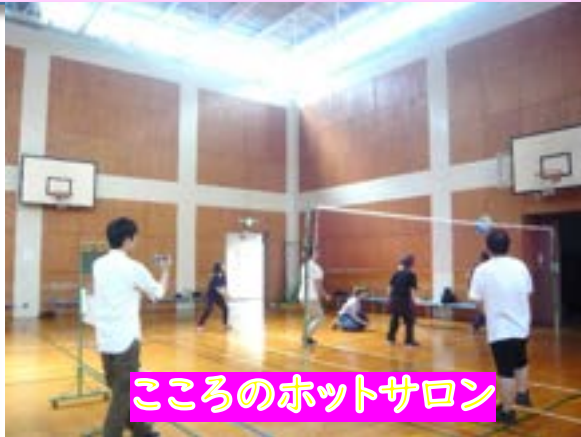
こころのホットサロン