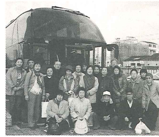
リフレッシュ後の笑顔の記念写真

平成十九年三月八日(木) 家庭で介護をされているご家族を対象に、貸切バスで京都への日帰り旅行を楽しみました。 排泄用具の情報館である「むつき庵」では、展示してある約二百種類のオムツを手にとつて確かめたり、実際にあてたりの実習も経験しました。他のオムツ関連の用具や、