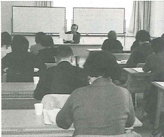
公開学習会の様子

子育てのネットワークづくりのプロジェクトでは、策定段階で明らかになってきた課題の解決に向け、就学前の子育てのネットワークの構築にとどまらず、0歳から18歳までの子育て、健全育成のゆるやかなネットワークづくりを目指して取り組みを進めています。 平成十八年十一月二十九日を第一回目の会議とし、地域住民、施設関係者、関係機関等が集まり、開学習会)に西成区の子育てネットワーク(わが町にしなり子育てネット)