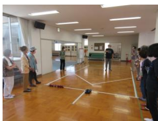
↑ポッチャ体験会の様子 みんなポッチャに はまったかな?