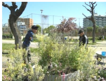
水やりの様子。花壇だけでなく、苗木にも水やりをします。

「コットン平野」は地域での花づくり活動を行っています。活動拠点は平野公園の南西の「平野区花づくりひろば」です。月火、水木、金土の3班に分かれて、今の時期は朝の水やり、苗の世話などを行っています。楽しいですよ。ぜひ、見学にいらしてください。