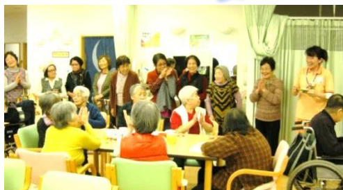
デイサービスセンターかがやき平野南にて

高齢者デイサービスの約40名の利用者さんと、手芸クラブのメンバー12名と一緒に折り紙でコマを作りました。