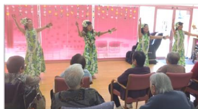
高齢者デイサービスももの香での活動の様子。

「フラスーキュアロハ」は「モアナ」に名前を変えました。「モアナ」とは「太平洋」「海」という意味です。ハワイでは女の子の名前によく使われています。私たち「モアナ」はみなさんを笑顔にしたいと活動しています。その笑顔で私達も元気をもらっています。