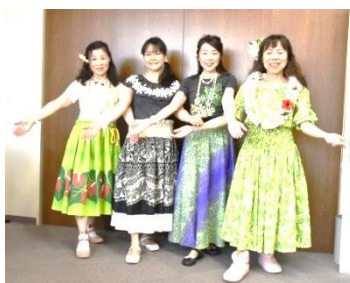
にこにこセンターのボランティアルームで練習中!