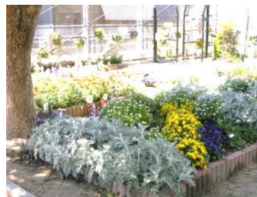
花がこぼれる様に咲いています。ぜひ、ごらんください。