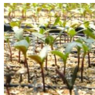
4月にまいた春蒔きの種は2センチほどの双葉に育っていました。