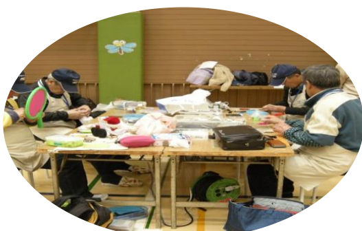
もくもくと修理をするおもちゃドクター