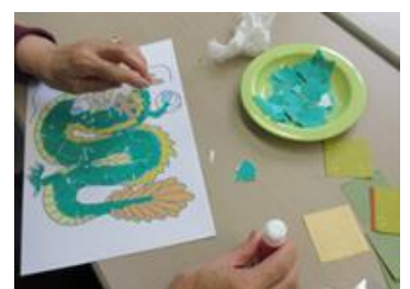
【干支ちぎり絵講座】