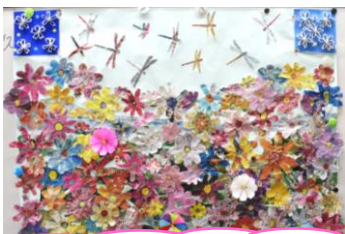
当センターエレベーター内に展示中！

新聞紙で「ちぎり絵」を一緒にやってみませんか？ ボランティアさんたちの交流の場所です！ 楽しくミニアート作品を作ってみましょう！！