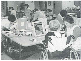
メイクボランティア活動中!!

お化粧品やマニキュアを施すうちに、昔話に話がはずみ、表情がいきいきと変化していく様子を見てると、やりがいを感じます。