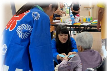
特別養護老人ホームにて イベントのお手伝い