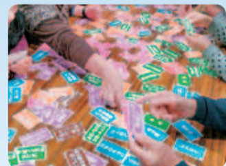
会場一体型参加プログラム「助け合いゲーム」の様子