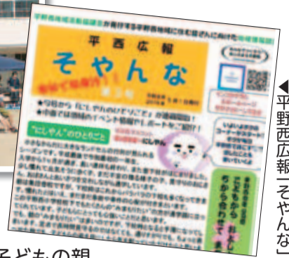
▶平野西広報「そやんな」

れまでも運動会のような高齢者と子どもと一緒に楽しめるようなイベントを行ってきたが、高齢者と子どもの親の世代との交流も増やしていきたい」と話されていました。