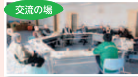
▲男性の仲間づくりグループ「The 男組」