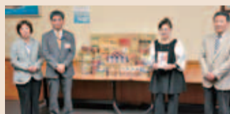
▲民生委員・児童委員協議会からの寄付

平成31年2月から令和元年5月までに、次の方々から、平野区社会福祉協議会 善意銀行