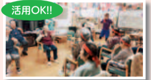
▲デイサービスなど空き時間の活用など