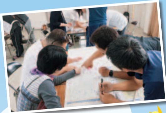
▲見守り活動(マップ作成)

平野区でも 新しい地域福祉活動が始まっています。 「子ども食堂」「子どもや高齢者の居場所づくり活動」などあなたのまちで始まっています！ ちょっと応援してみませんか？