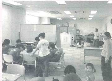
和っしょい!ひらの

地域共生サロンは、「知らない」ことから生じる無関心をなくし、お互いを「知る」楽しみやみんなで支え合うまちづくりをめざし活動しています。「和っしょい!ひらの」では引き続き、地域共生サロンの開設を推進しています。