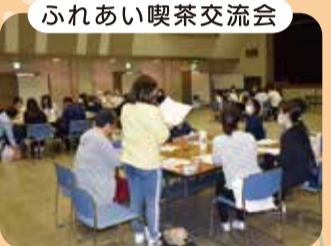
ふれあい喫茶交流会