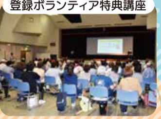
登録ボランティア特典講座