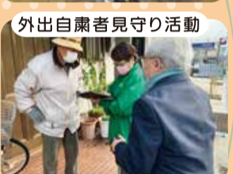
外出自働者見守り活動