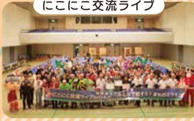
にここ交流ライブ