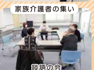
家族介護者の集い