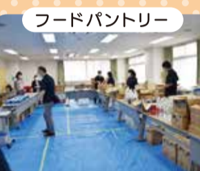
フードパントリー