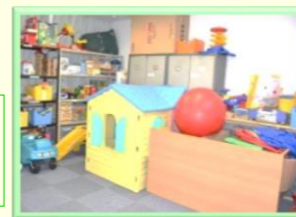
「にこっと」のおもちゃ いっぱい!

クリスマス手づくりクッキーと バルーンアートのプレゼント に、みんな大喜び♪(12/10)