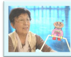
てつぼうアンパンマン

7月、8月の活動日 7月17日(日)、8月21日(日) 13:00~16:00 平野区平野本町 4-12-21 全興寺「おもろ路」