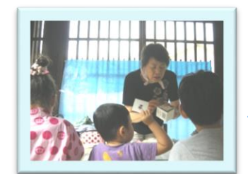
牛乳パックカメラでカシャッ!