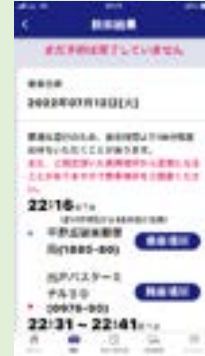
⑦内容を確認し、予約を確定する