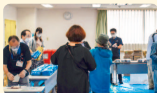
▲食糧を配布している様子

8月1日と15日に『赤い羽根共同募金「いのちをつなぐ支援活動応援! ~支える人を支えよう~」事業助成金』を活用して開催しました。コロナ禍の長期化により