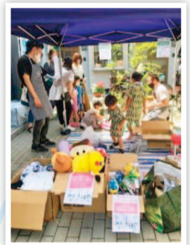
▲緑日イベントの様子

親子づれや子どもだけでも立ち寄れる子ども食堂併設のコミュニティカフェとして定期開催できるよう準備されています。現在はコロナ禍により不定期開催にはなりますが、カレーやおやつのテイクアウトなど、いろいろ工夫しながら行われています。ボランティアのみなさんからは「おいしそうに食べる子どもたちの姿や笑顔から元気をもらいました。また活動したいです」との声がありました。