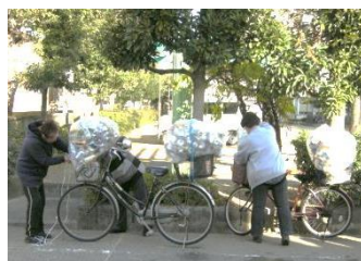
「地域で安心して暮らしたい」そんな想いを支えるやさしいボランティア活動ですね。