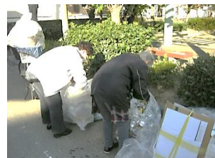
回収した古新聞、空き缶などを運びやすいように整理してします。

10数名のメンバーが何か出来ることはないかと思っていたところ、高齢者にとっては、古新聞などはけっこう重く、持ち運びがたいへんとの声があったので、古新聞やアルミ缶を、玄関先にだしてもらい、回収、分別して各業者に運び、換金して、年に数回ですが、換金した利益でトレットペーパーを購入、古新聞などを提供していただいた住民の方にお配りして、みなさんに喜んでいただいています。