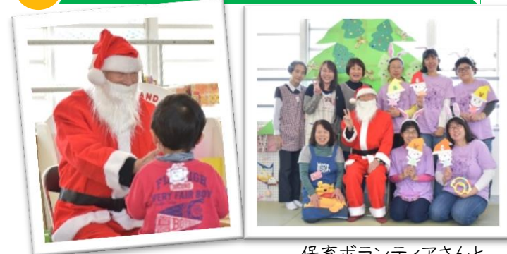
勇気をだして あく手する子も♡