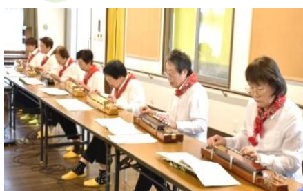
敬老会で大正琴の日頃の練習の成果を発表しました(^_^)/