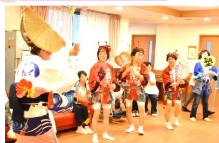
みなさんの笑いが私たちの励みです！