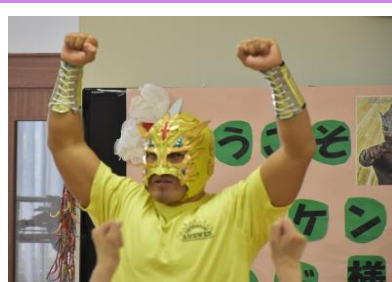
プロレスラーに会えるなんて素敵!!!