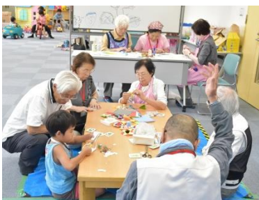
おもちゃ図書館「にこっと」の夏祭りでは「びよんびよんガエル」などを作りました。