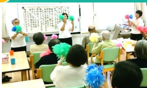
「寝たきりに ならない、させない、つらない」をモットーにがんばります。