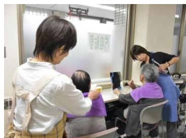
高齢者施設で、傾聴しながら整容しています。一緒にボランティアしませんか？