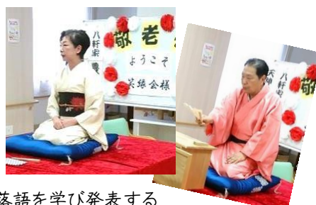
落語を学び発表するアマチュア落語家のグループです。あたたかいネットワークを広げていきたいと考えています。お楽しみくださいね。