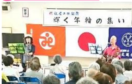
敬老会になつかしい曲をお届けしました。