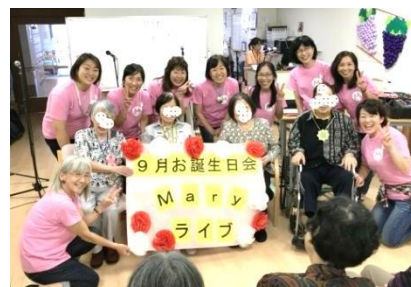
「元気をもらえた」って、うれしいお言葉をいただきました♪♪♪