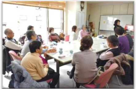
ボランティアルームにて

「フレンドリー」は視覚障がい者の外出支援や高齢者施設でのボランティア活動など多方面で活動しています。今日は「視覚障がい者女性部」と「フレンドリー」の交流会です。寒い時期なので、絵本の読み聞かせを聴いて楽しい時間を過ごしました。(2/7)